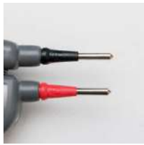
Puntas atornillables 4 mm (juego de 4 piezas)