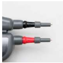
Puntas de las sondas para empujar (limitadores) 4 mm