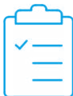
Certificado de calibración con acreditación