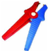
2 x cocodrilo Kelvin 1 kV 25 A WAKROKEL06