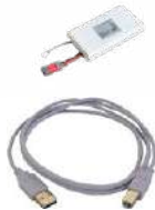
Batería recargable de ion-litio 7,2 V WAAKU27