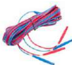
Cable de dos hilos (10 / 25 A) U1 / I1 6 m / 10 m / 15 m

WAPRZ006DZBBU111 WAPRZ010DZBBU111 WAPRZ015DZBBU111