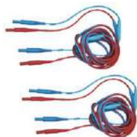
Cable de dos hilos (10 / 25 A) 3 m