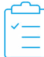
Certificado de calibración de fábrica