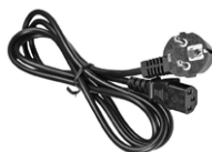
Cable de alimentación 230 V IEC C13