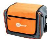
Funda L11 WAFUTL11