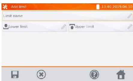
Posibilidad de configuración de límites

El medidor de resistencia de bobinados y bajas resistencias MMR-640 está equipado con una pantalla táctil a color legible que, debido a su resolución de 800 x 400 píxeles, proporciona alta comodidad de interactuar con la interfaz y una alta legibilidad de los resultados medidos.